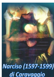
Narciso (1597-1599) di Caravaggio

Divertirsi con le simmetrie. La simmetria è un argomento affascinante che attrae adulti e bambini. Essa è presente nella realtà quotidiana più di quanto possiamo immaginare. Attraverso un percorso di scoperta operativa, la simmetria verrà introdotta con la manipolazione di materiali e l'utilizzo di software, e successivamente con l'osservazione e la successiva rielaborazione mentale e verbale. Grazie a schede di lavoro, gli alunni saranno invitati a descrivere gli elementi di simmetria delle figure geometriche, a metterle in relazione tra loro, a formulare congetture e verificarle, a proporre definizioni, offrendo così uno stimolo a processi di scoperta e apprendimento.